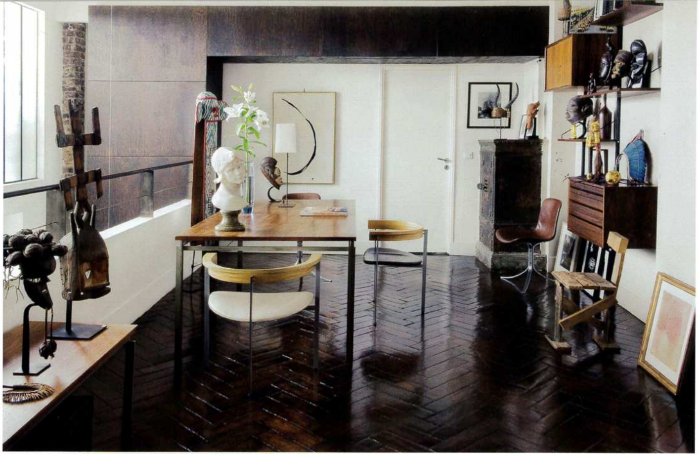
un mur de bois traité façon ébène file sur les trois étages et réunit l'espace